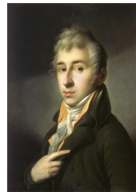
Н.М. Карамзин в молодости

Из пансиона Карамзин вынес знание европейских языков (немецкого, французского, английского, итальянского, греческого и латыни) и уважение к славному тогда немецкому моралисту Геллерту (по лекциям Геллерта в пансионе преподавали нравоучение, т.е. этику). По окончании пансиона он отправился в Петербург для поступления на действительную службу. По традиции того времени еще при рождении Карамзин был записан в Преображенский полк. Однако военная карьера его нисколько не прельщала. Поэтому, воспользовавшись первым же предлогом (смертью отца), в 1785 г. Карамзин вышел в отставку и уехал в Симбирск, где, по словам современников, вел светскую жизнь.