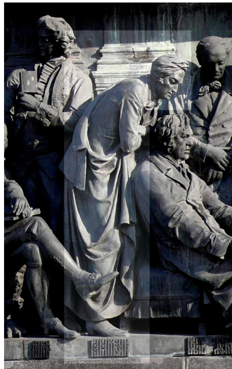
Фигура Н.М. Карамзина на Памятнике тысячелетию России в Новгороде

Путешествие в глубь веков стало для него последним.