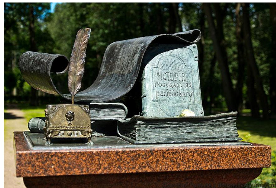
Памятник Н.М. Карамзину в подмосковной усадьбе Остафьево